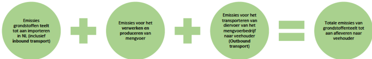
Figuur 2: Vereenvoudigde weergave van de scope van de GFLI Nederlandse toepassing CFP database 2026 voor droge grondstoffen.

De CFP database heeft als scope de emissies vanaf het telen van de grondstof tot aan het afleveren van het (meng)voer op het boerenerf. Dit is in Figuur 2 voor de droge grondstoffen vereenvoudigd weergegeven. Voor de vochtrijke grondstoffen en ruwvoerders geldt dat deze vrijwel niet tot mengvoer worden verwerkt, bij deze grondstoffen komen dus geen emissies vrij tijdens het verwerken en produceren tot mengvoer.